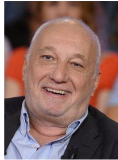
François Berléand Rôle : beau-père de Valentin