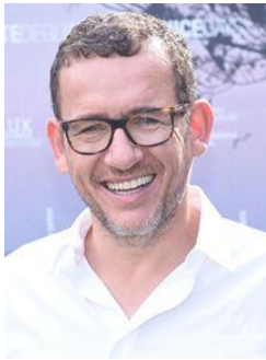
Dany Boon Rôle : Valentin D.